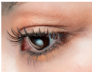
EYELASH RECIPE カジュアルデザイン