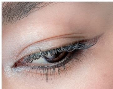
EYELASH RECIPE カジュアルデザイン